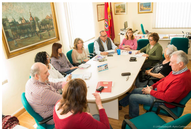
Ilustración 12 - Reunión Manifiesto Fénix