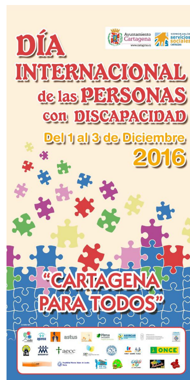
Ilustración 11 - Día Internacional Personas con Discapacidad