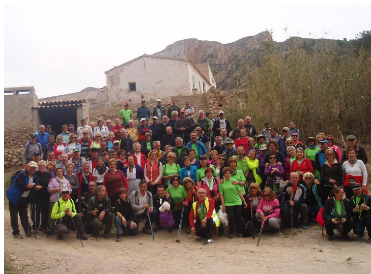
Ilustración 9 - Programa Senderismo Senior