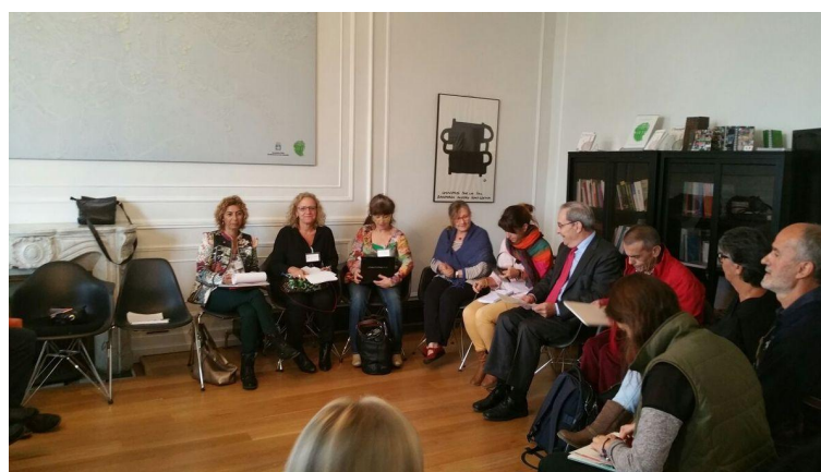
Ilustración 16 - Reunión RECI