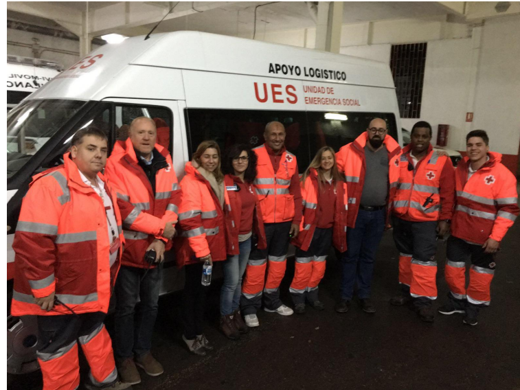
Ilustración 3 - Campaña Ola de Frío