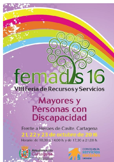
Ilustración 7 - FEMADIS 2016