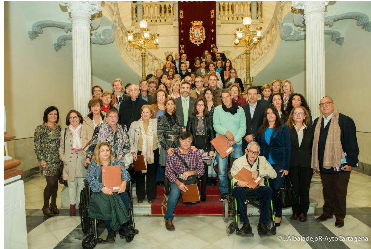
Ilustración 17 - Entrega subvenciones