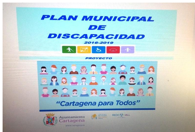
Ilustración 10 - Plan Municipal Discapacidad