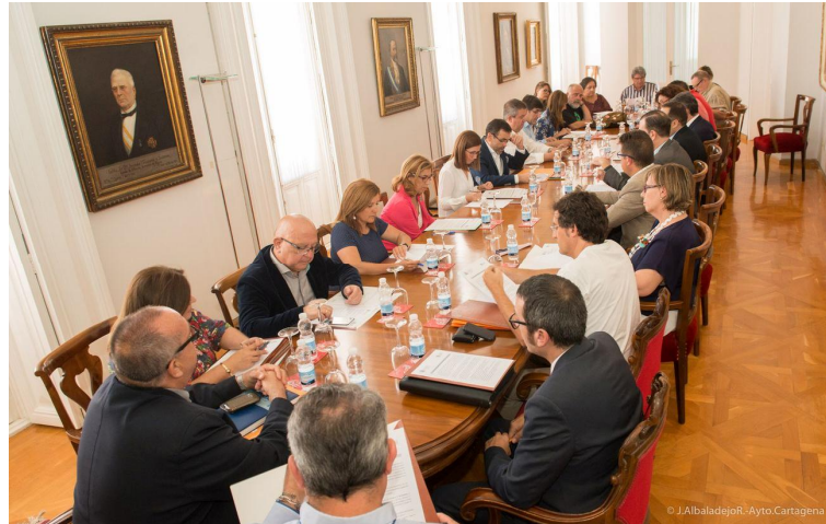
Ilustración 2 - Mesa Local Vivienda

propuestas para elaboración de Guía de Recursos, se ha realizado un análisis de la problemática relacionada con la disposición de vivienda y se han mantenido reuniones periódicas de coordinación, información y divulgación entre colectivos, la PAH y la FAVCAC.