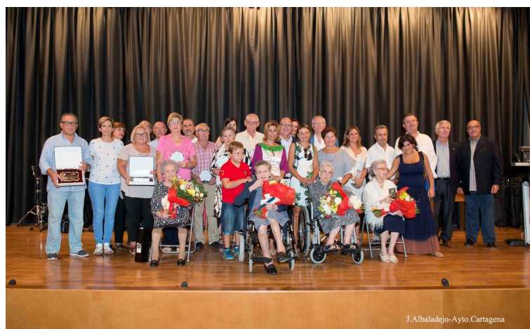
Ilustración 8 - Día Internacional Personas Mayores