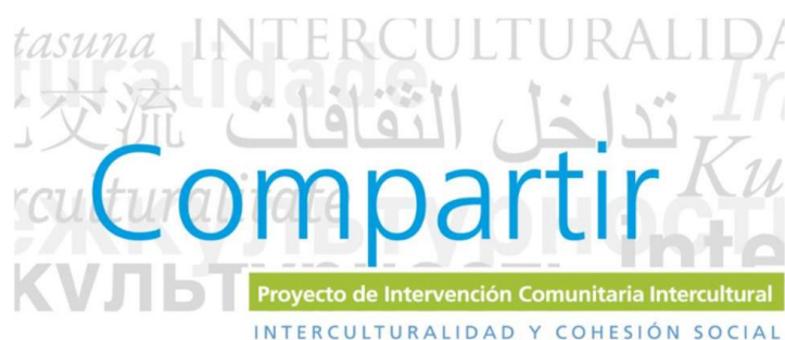
Ilustración 14 - Proyecto ICI