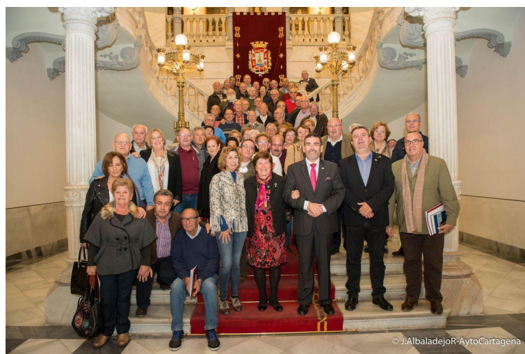
Ilustración 6 - Firma convenios mayores