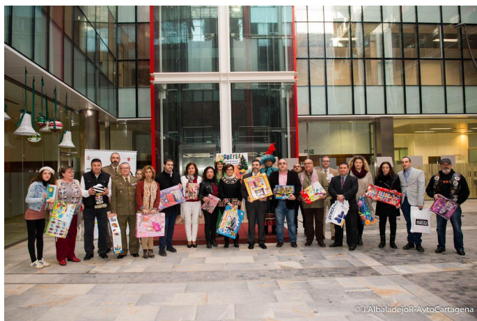
Ilustración 18 - Campaña Juguetea