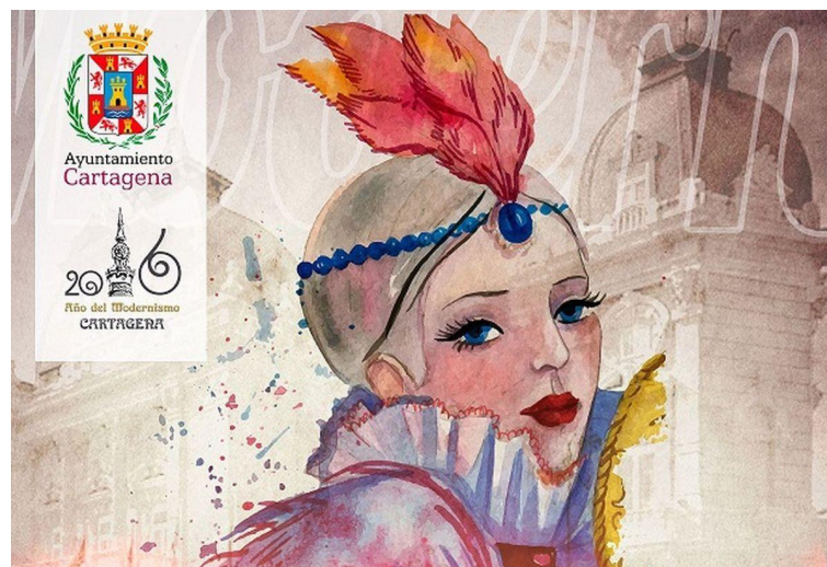
Ilustración 13 - Mercado Modernista