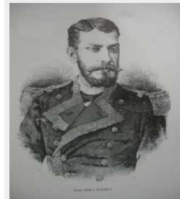
El inventor Isaac Peral y Caballero