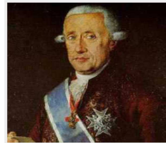
Floridablanca, presidente de la Junta Central

Camacho Felizes Francisco de los Cobos y Molina Nicolás de Villacís Cardenal Luis Belluga Francisco Salzillo Roque López Conde de Floridablanca Gil Francisco de Molina y Junterón Salvador Jacinto Polo de Medina Diego Mateo Zapata Isidoro Máiquez Sor Úrsula Micaela Morata Diego Saavedra y Fajardo Luis Pacheco de Arzoniz