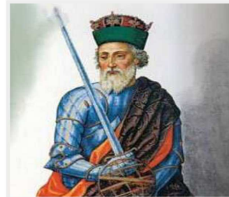
El Rey de Castilla y León Alfonso X 'El Sabio'

Abd Al- Rahman II Ibn Arabí Ibn Sabin Al-Ricotí Ibn Hud Infante don Juan Manuel Alfonso X 'El Sabio'