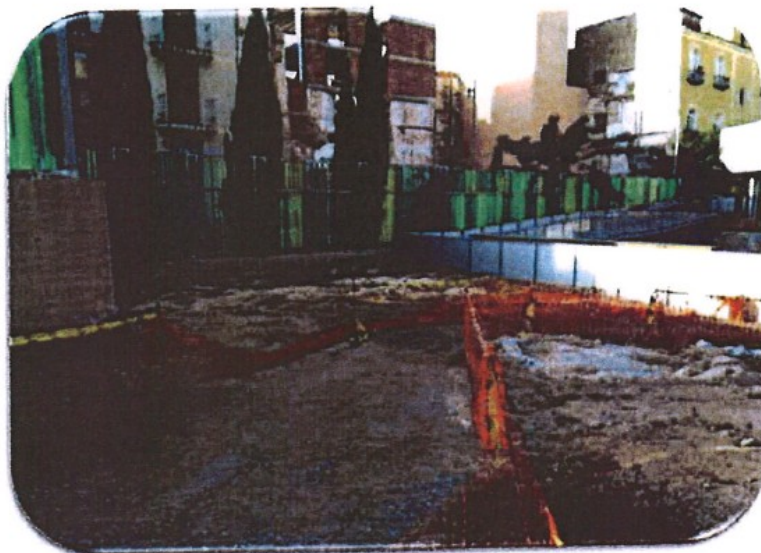
Estado actual que ofrece la zona donde se ha previsto un área de descanso.

Este Proyecto contempla la puesta en valor y musealización del Foro colonial, realizando una obra de reconstrucción monumental de algunas de sus estructuras, y la conexión de este con el Santuario de Isis de la Insula II; asimismo, prevé una zona de descanso y sombra. Dado el estado de conservación del foro, se ha previsto la reposición de los volúmenes no conservados, partiendo del estudio pormenorizado del bien, empleando sillería de reposición, procedente en ocasiones de las mismas canteras empleadas en la antigüedad.