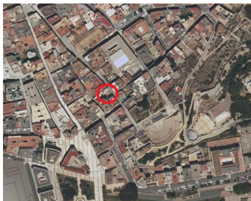
Situación de la parcela en ortoimagen.

La parcela objeto de estudio se localiza en la Calle Andino N.º 6, Cartagena (Murcia). Esta parcela con referencia catastral [REDACTED], abarca una superficie de 207,50 m 2 .