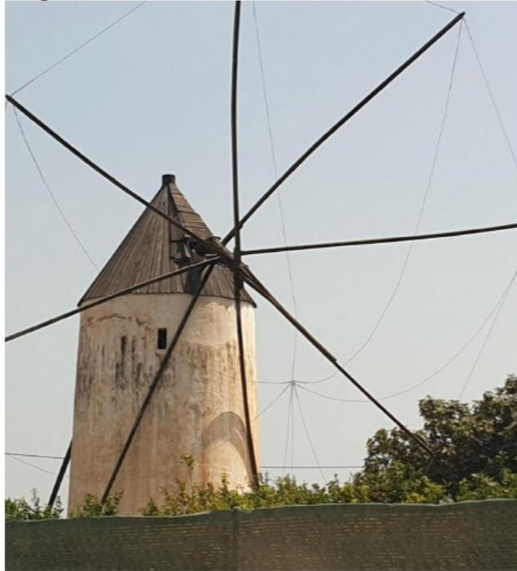
Fotografía del molino 'Del Pollo' actual en 2023