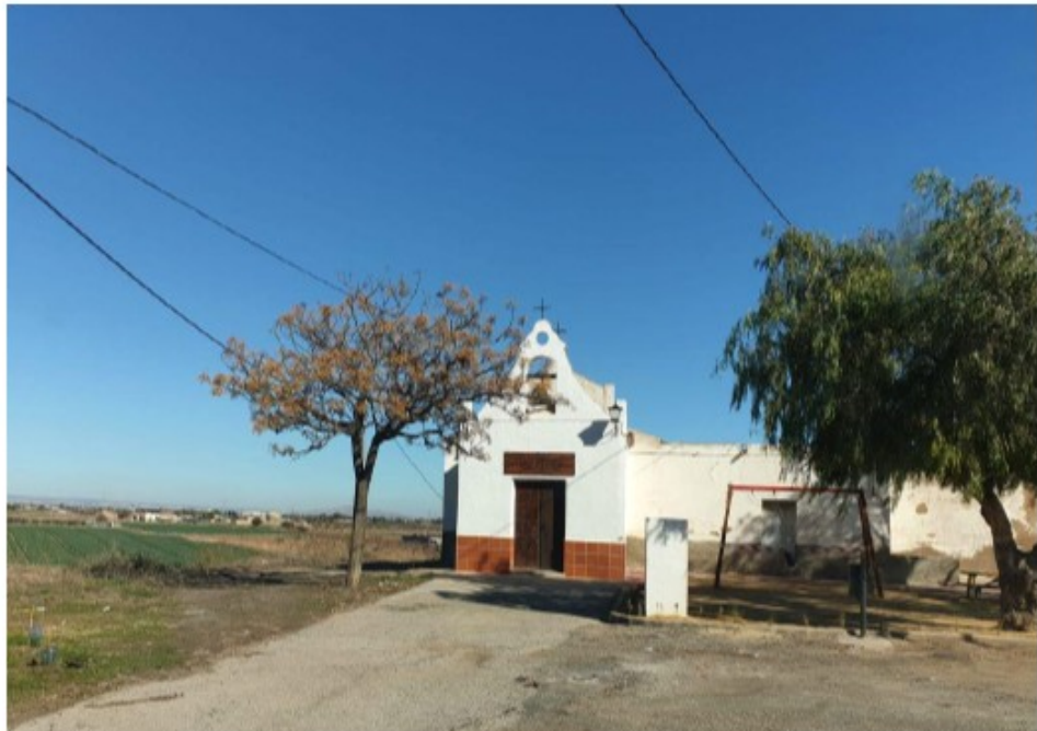
Ermita de La Magdalena

Acta sesión ordinaria Pleno de 7 de septiembre de 2023