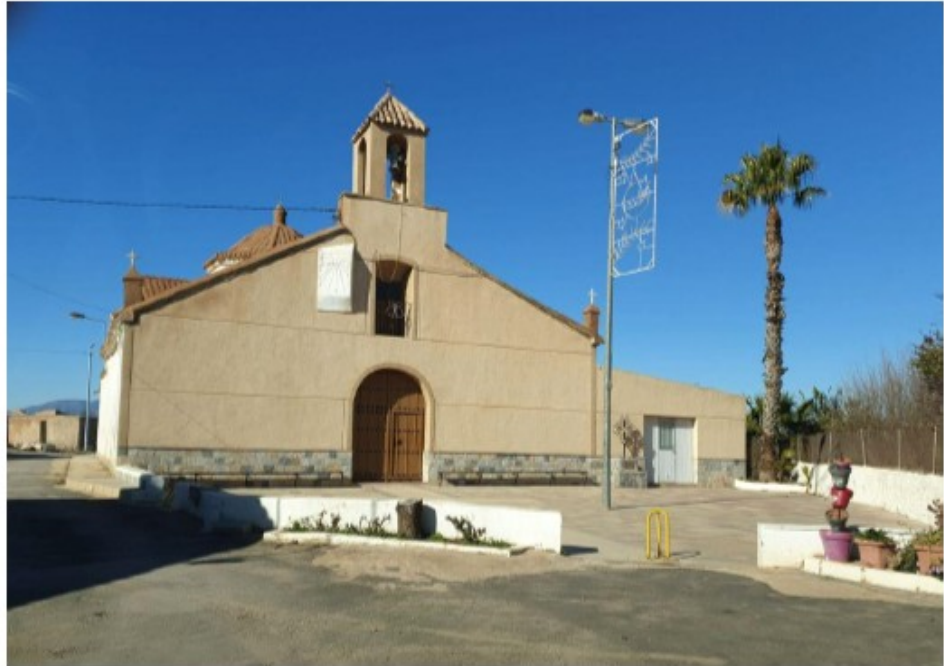
Ermita de La Mina