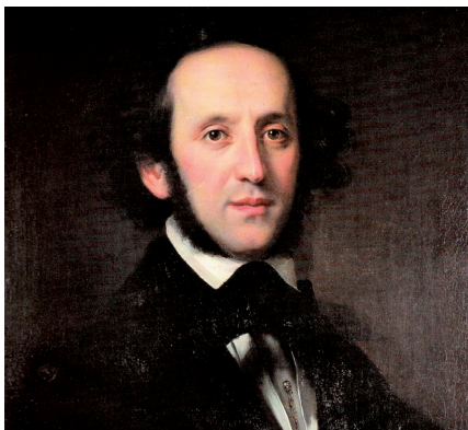
Retrato de Felix Mendelssohn en 1846, por Eduard Magnus.

El apogeo de la música instrumental en el siglo XIX trajo consigo el gusto por el virtuosismo. Como Paganini con el violín o Liszt con el piano, Bottesini fue un instrumentista capaz de llevar al límite sus posibilidades técnicas, siendo conocido como el "Paganini del contrabajo". Sin embargo, la figura del genio, el ser superior que se auto-sacrifica por entregar su obra a la humanidad, era la que más admiración despertaba. En este sentido, Beethoven se tomó como ejemplo a seguir. Sin duda, sus nueve sinfonías contribuyeron al desarrollo del género, y compositores posteriores como Brahms, Mahler o Bruckner las tomaron como modelo.