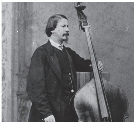
Retrato de Giovanni Bottesini