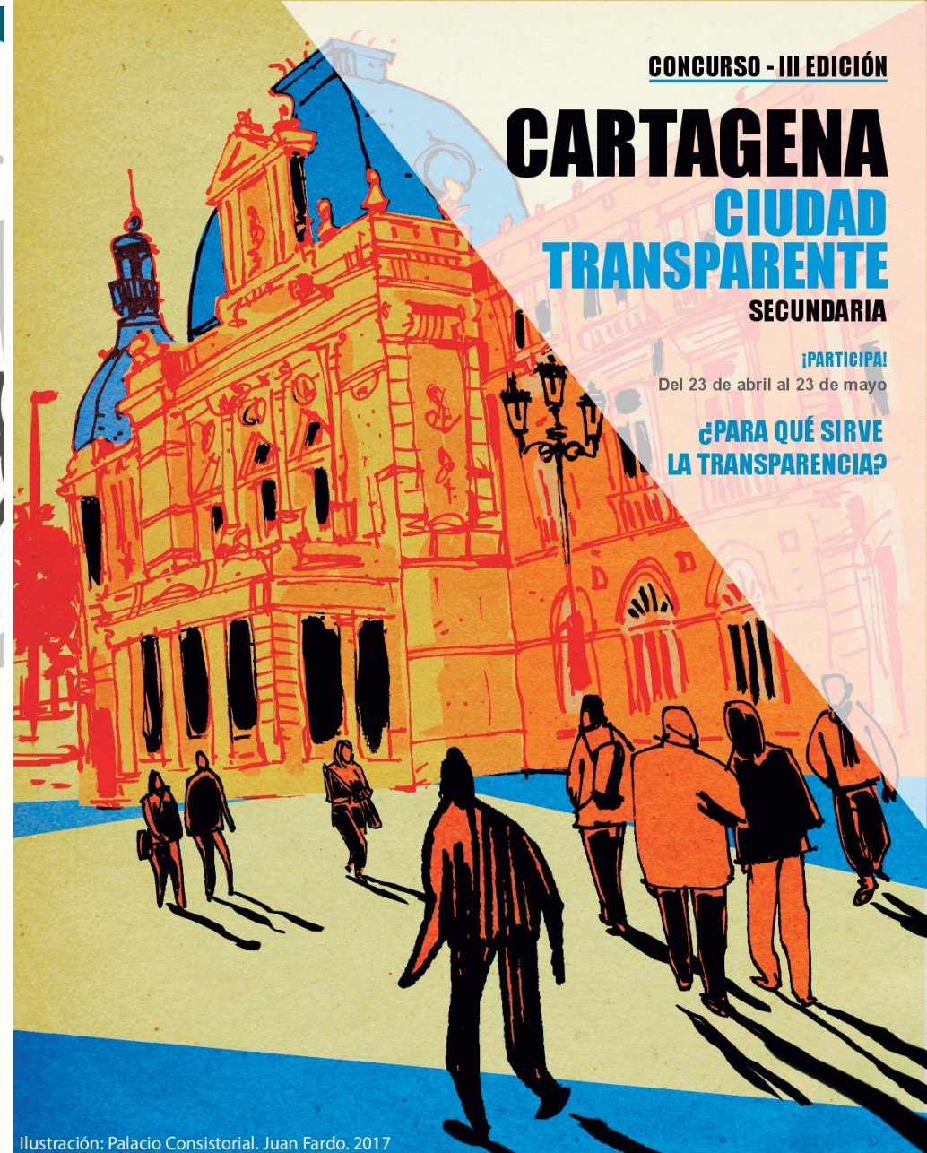
Ilustración: Palacio Consistorial. Juan Fardo. 2017