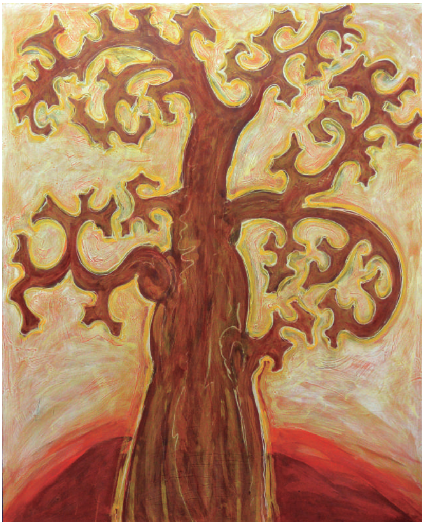
<< Alessandro Del Gaudio Estacionamiento entre garabatos. Acrílico sobre lienzo. 100X100 cm.