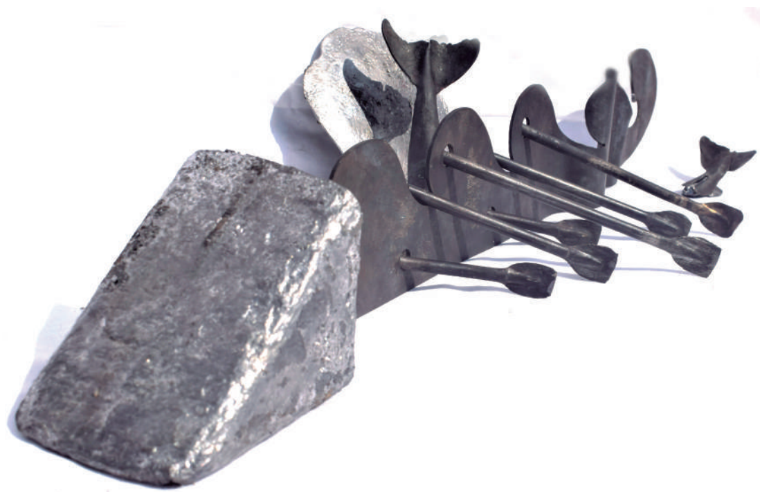
Antonio Cifuentes López Alétheia. Plomo y acero inoxidable. 8X55 X2 cm.