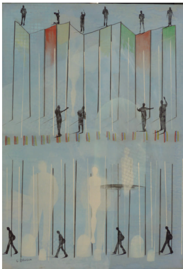
Carlo de Lucia ADE-Shadow, Apriti cielo. Mixta sobre tela. 90X100 cm.