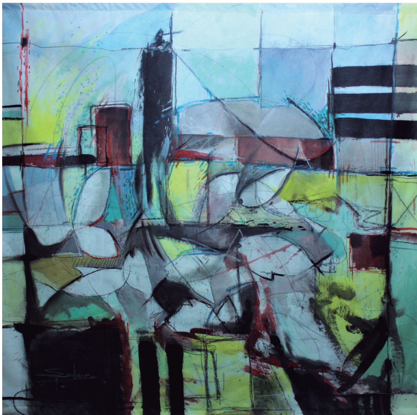
Antonio Requena Solera Frutti di mare II. Acrílico-mixta sobre tela. 160X160 cm.