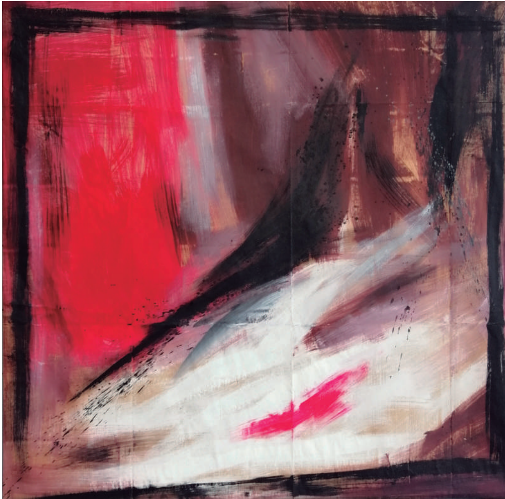
Nunzia Re Luoghi della mente. Acrilico sobre papel. 80x80 cm.