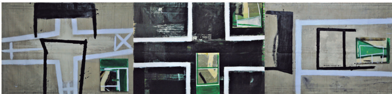
Lucio Afeltra Approdo. Técnica mixta. 140X582 cm.