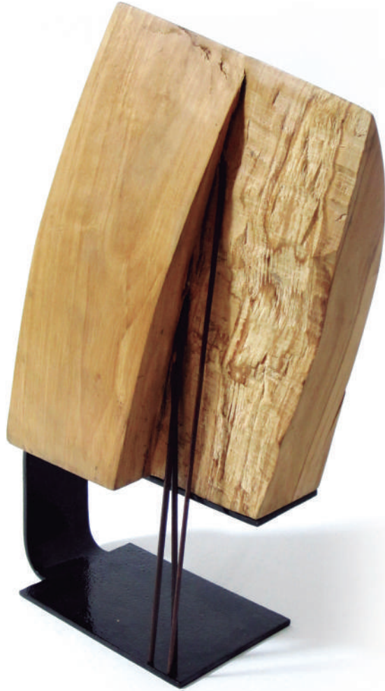
Antonio Vidal Máiquez Frontera. Madera y acero. 40x20x10 cm.