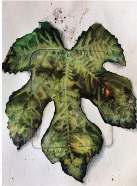
Pau Pellín Polidíptico con hojas de higuera. Acuarela sobre papel. 24X24 cm cada una.