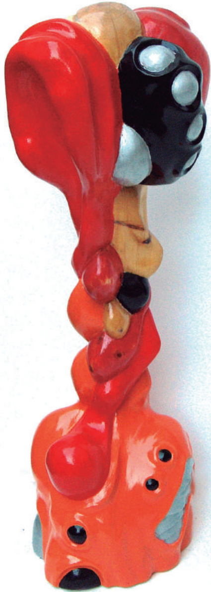
Ginés Vicente Naranja. Cíprés policromado. 70X18X20 cm.