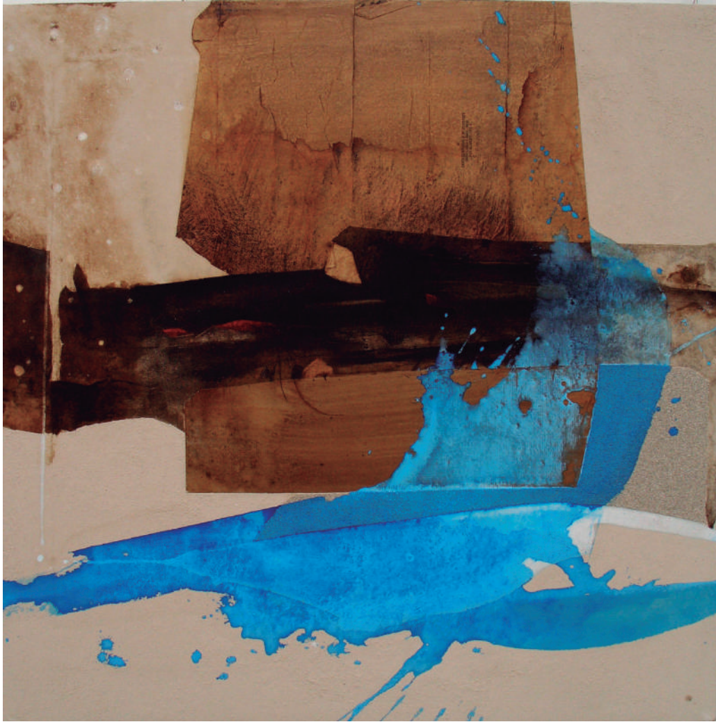
Marco Pili Campo di stelle. Mixta y tierra sobre tela. 80X80 cm.