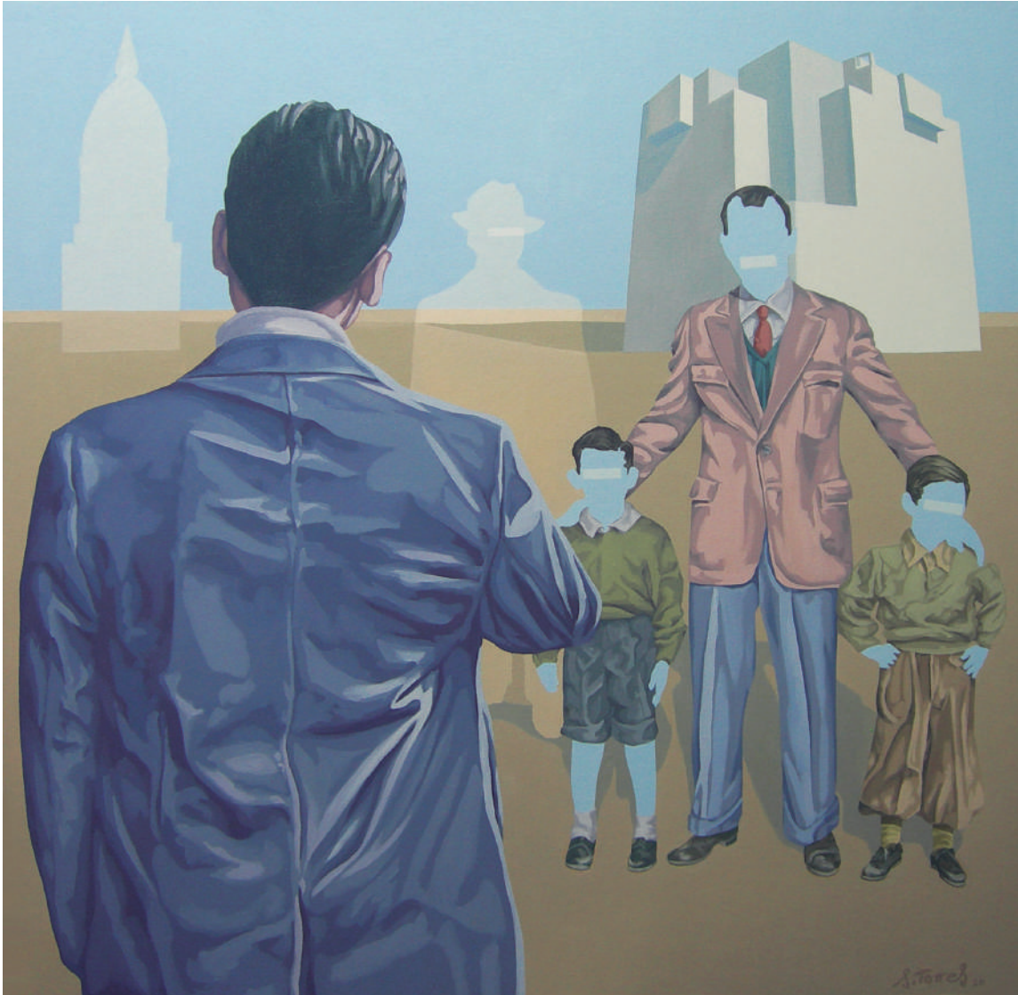
Salvador Torres El veto. Óleo sobre lienzo. 101x101 cm.