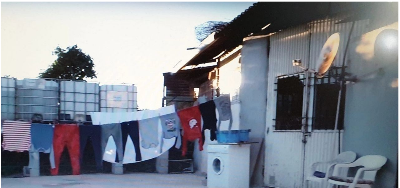
Las Lomas del Albuñón