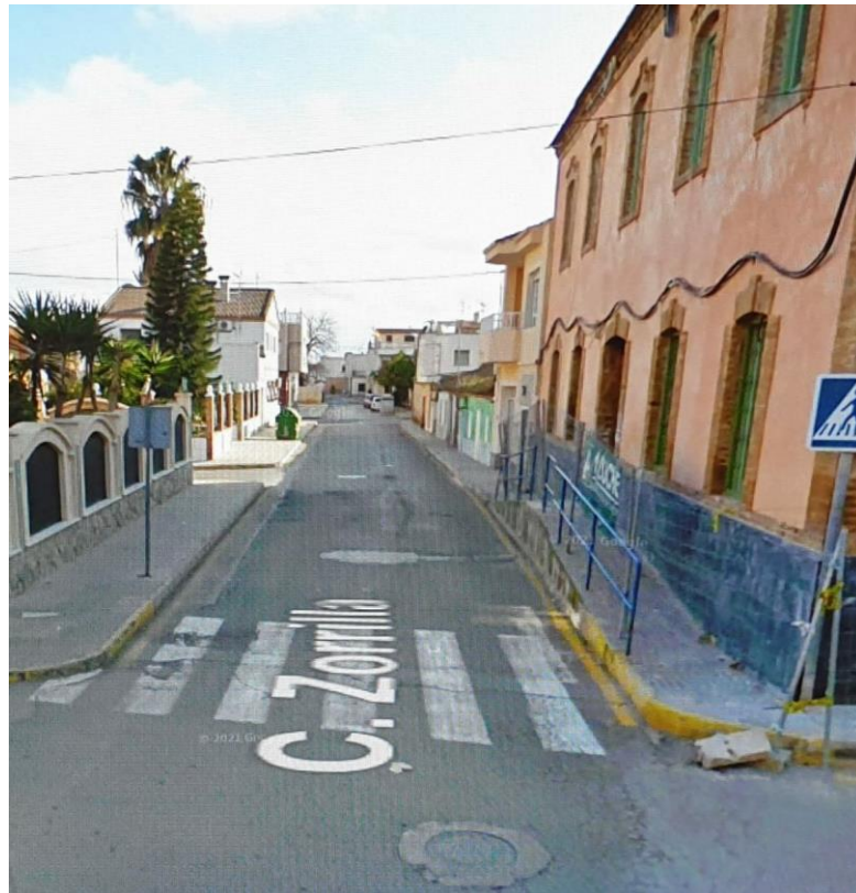
Necesidad de rebaje en paso de peatones sin ejecutar en El Algar