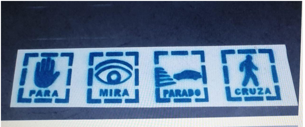
Pictogramas en pasos de peatones para personas con trastornos del espectro autista (TEA)