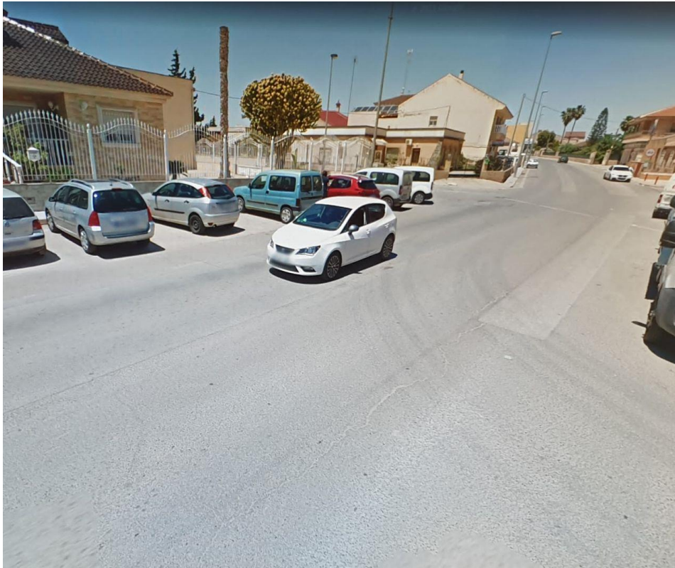
RM605, a su paso por La Aljorra (nula señalización horizontal)