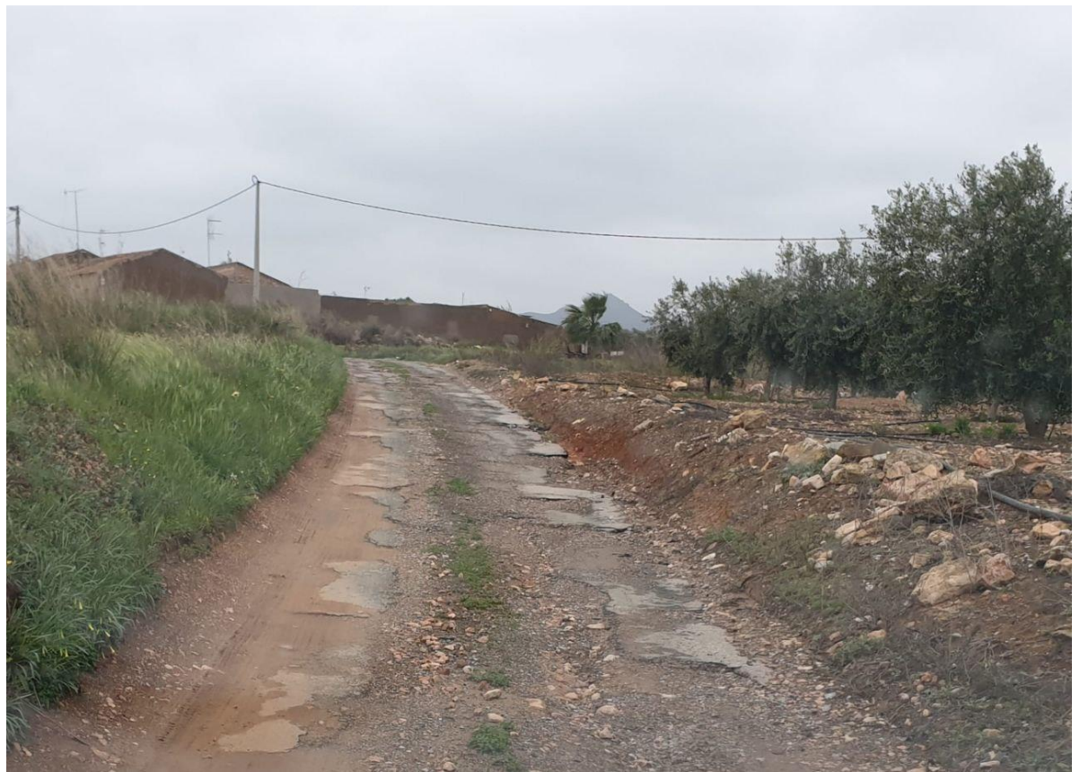
Camino de Lo Castillejo