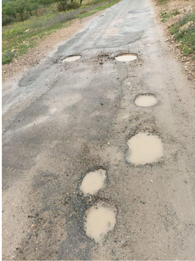
Camino de Castilla a Los Pinos