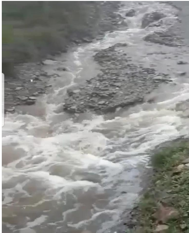
Rambla de Los Jarales