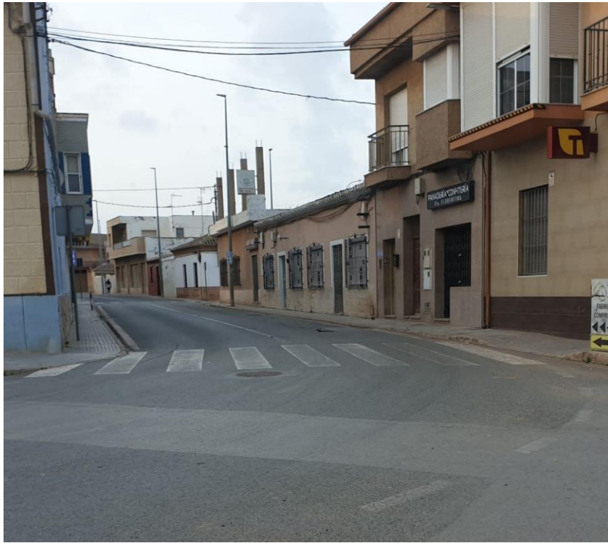
Paso de peatones en La Palma que precisa de señalización lumínica