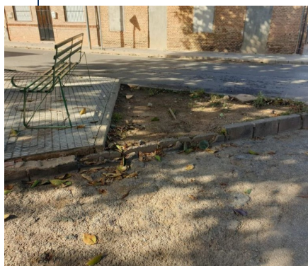
Isleta en calle Concepción

Código Seguro de Verificación: H2AA QJC7 RDXH PXV4 A9WK