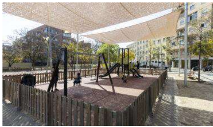
Ejemplo de zona de sombra para juegos infantiles 1.