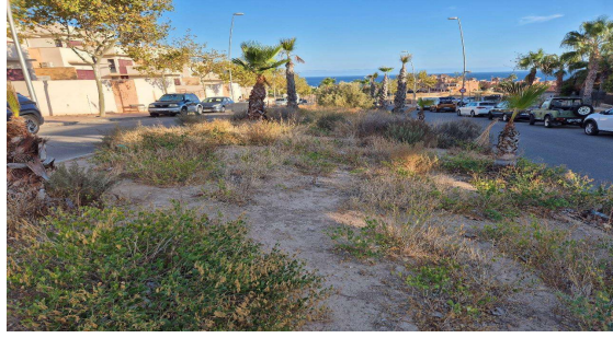
Fotografía correspondiente al estado de la mediana en la Calle Isla del Cangrejo, que ha quedado fuera de contrato de limpieza a día 20 de septiembre de 2025.