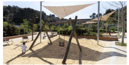
Ejemplo de zona de sombra para juegos infantiles 2.