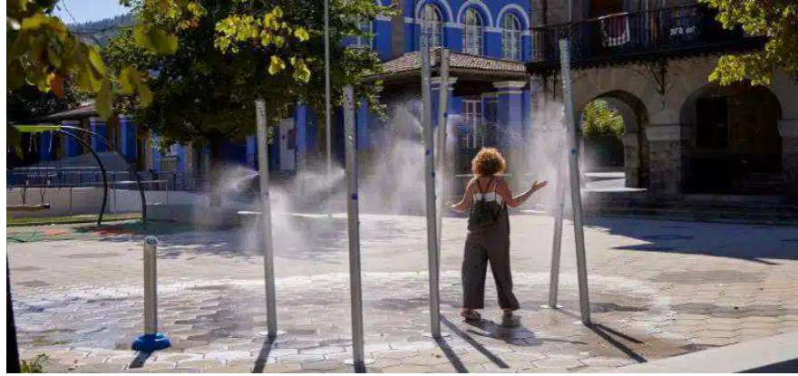
Ejemplo de aspersor público.

Que el Pleno de esta Junta Vecinal solicite e inste al Gobierno municipal y, en su caso, al de la Comunidad Autónoma, a diseñar y ejecutar un plan para la creación de sombras en zonas de juegos infantiles y de alta concurrencia ciudadana; y la instalación de un aspersor en las tres plazas públicas principales del área de influencia de esta Junta.”