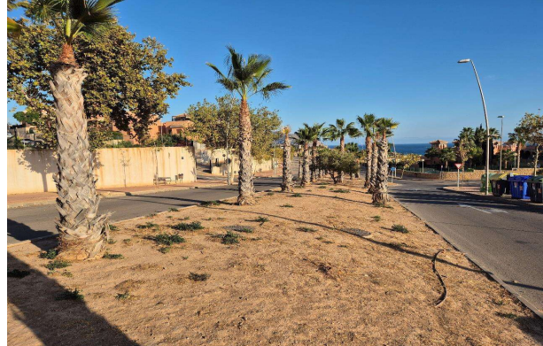
Fotografía correspondiente al estado de la mediana en Calle Isla del Cangrejo, que ha quedado dentro del contrato de limpieza a día 20 de septiembre de 2025.