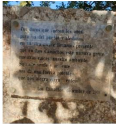
Placa a la que le faltan letras en Los Camachos