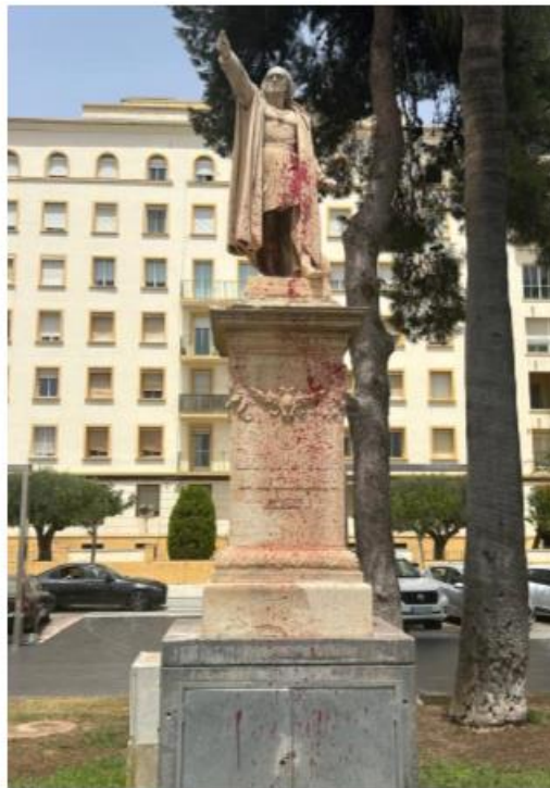
Monumento a Colón sobre un cuadro eléctrico