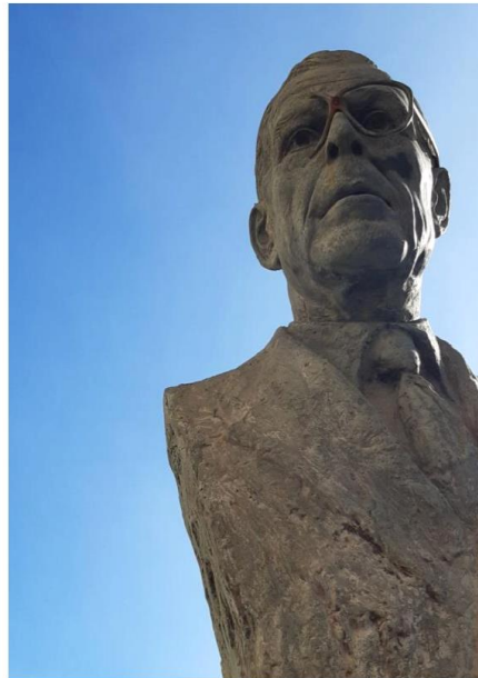
Busto de García Segura con las gafas rotas