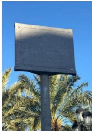
Placa y fuste deteriorados en La Palma