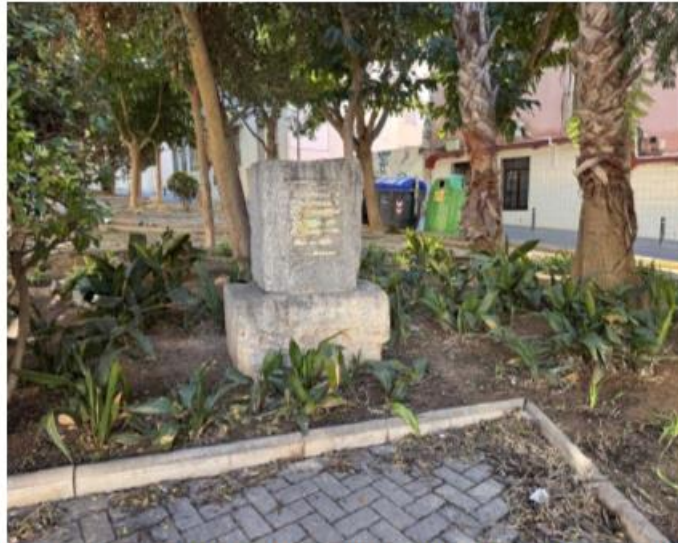
Lugar donde estaba la placa dedicada al poeta José Hierro