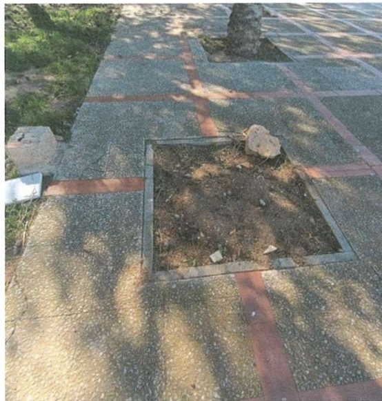
No hay reposición de arbolado