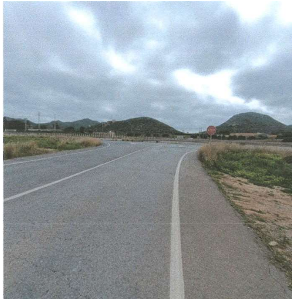
Stop en la incorporación a la carretera de servicio con falta de alumbrado