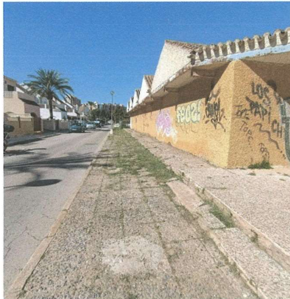
Falta de mantenimiento y desidia